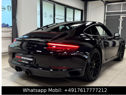
Whatsapp Mobil: +4917617777212