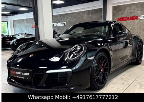
Whatsapp Mobil: +4917617777212